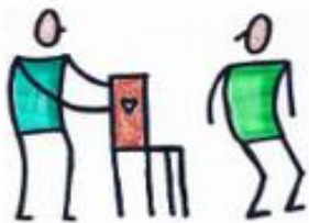
anderen helfen können