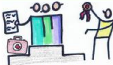
zertifizierte Kurse (z.B. Ersthelfer)

In unserer Berufsorientierungs-AG zeigen wir Dir, in welchen tollen Berufen Du sozial arbeiten könntest. Du bekommst einen Überblick in verschiedene Arbeitsbereiche (Gesundheit/Pflege, Erziehung und Rettungswesen) und darfst Dich selbst ausprobieren. Wir werden uns auch verschiedene Berufsfelder bei Betriebsbesuchen anschauen und zertifizierte Kurse im Rahmen der AG anbieten. Vielleicht entdeckst Du während der AG Deine Kompetenzen und möchtest in Deinem nächsten Schulpraktikum mehr über einen bestimmten Beruf erfahren.